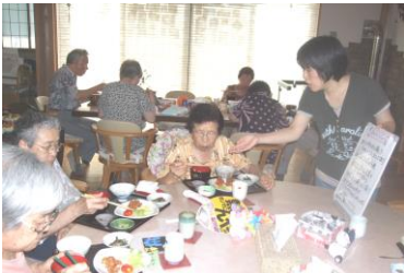
今日のメニューをお知らせします。お味はいかがですか？