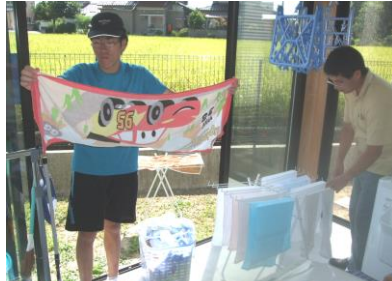
大量の洗濯物は干すのも一仕事。夏休みで来所していた中学生が手伝ってくれました。