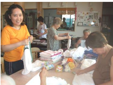
洗濯物たたみも皆さんで。大助かりです。