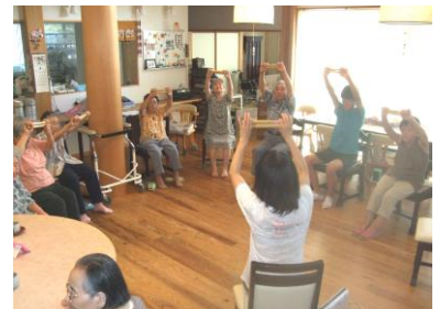
2 時からは、ボランティアの先生による骨体操。日によって、健康体操や書道、詩吟などの先生が来所されたり、スタッフといっしょに小物を作ったり、ゲームをしたり・・・。