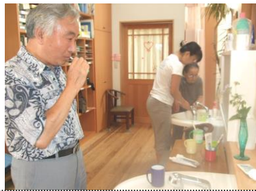
食後の歯磨き。歯ブラシとコップは消毒して保管します。