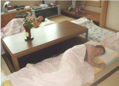
4 台のベッドと和室の布団で休息。身体をしばらく横にするのもいいですね。