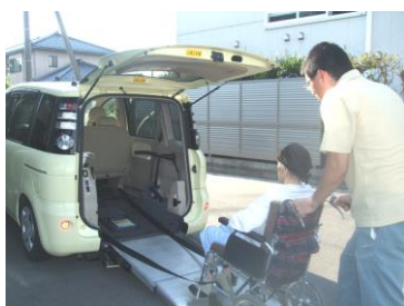
午後 4 時 30 分。あっという間にお帰りの時間。「ありがとうございました。また来てくださいね」「楽しかったわ、またね！」