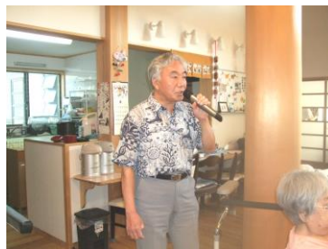
時間の許す限り、カラオケや懐かしの歌を、みんなで楽しめます。