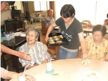
3 時のティータイムには、コーヒーやカルピスなど飲み物ご希望で！