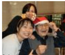
12月18日~23日はクリスマスウィーク