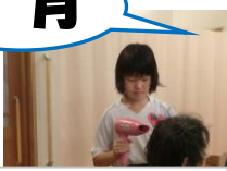
「14歳の挑戦」中。 真剣そのもの!