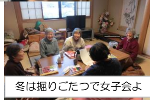
冬は掘りごたつで女子会よ