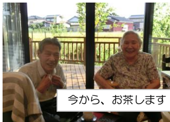
今から、お茶します