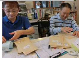
宛名貼りのお手伝い