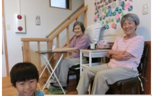
仲良く足の運動でーす