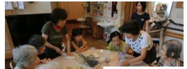
ハーブ石鹸作り。 お風呂で使います!