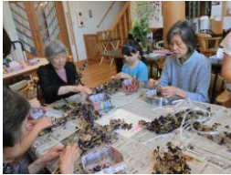
ハーブの入浴剤作り