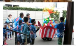
町内の子供みこしが 来てくれました