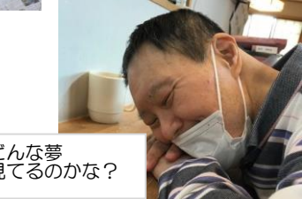
どんな夢 見てるのかな？