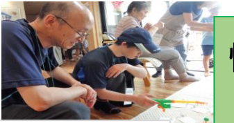
上手く釣れるかな？