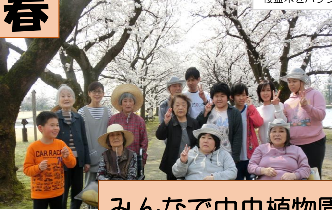
桜並木をバックに、はい、チーズ!!