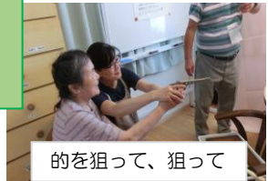
的を狙って、狙って