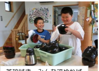
茶碗拭き、みんなでやれば すぐ終わる