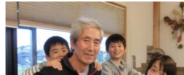
おんぶするって久しぶり