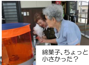
綿菓子、ちょっと小さかった？