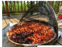
梅干し作りに初挑戦！