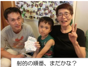
射的の順番、まだかな？