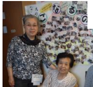
ガールストークも楽し