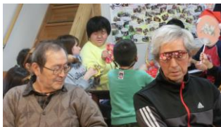
兄貴、そのサングラス、 どこで手に入ります?