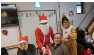
プレゼントは何かな?