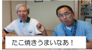
たこ焼きうまいなあ！