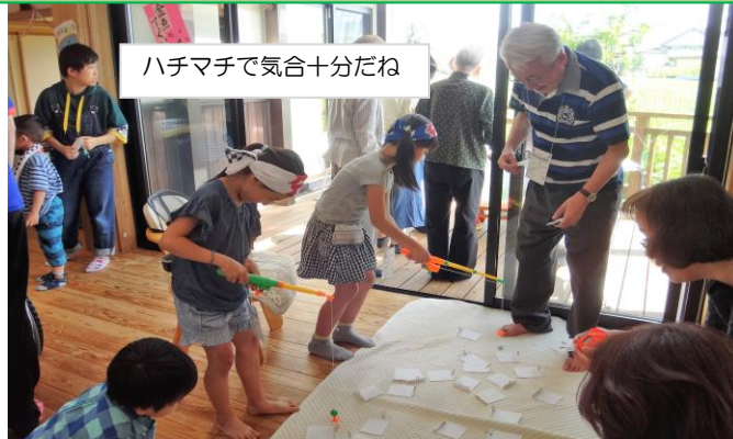
ハチマチで気合十分だね