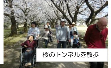
桜のトンネルを散歩