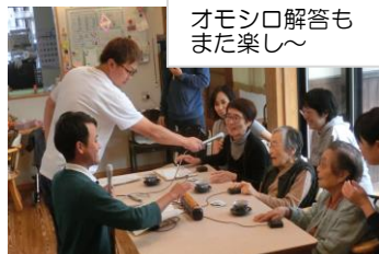
オモシロ解答も また楽し〜