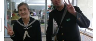
年の差 70 歳のカップル誕生!