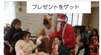
プレゼントをゲット