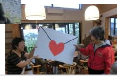
大ラプレターは手作り