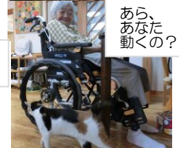
あら、 あなた 動くの?