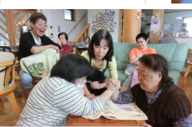
利用者さん対抗 「なごなる腕相撲大会」?!