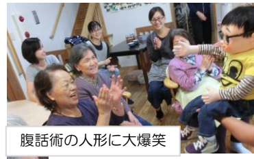
腹話術の人形に大爆笑