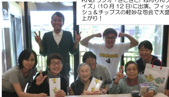
KNB ラジオ「きときと! ねんりんクイズ」(10月12日)に出演。フィッシュ&チップスの軽妙な司会で大盛り上がり!