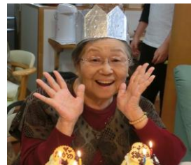
ハッピーバースデー!!!