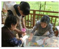
この金魚、動かないから、いいわね