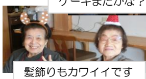
髪飾りもカワイイです