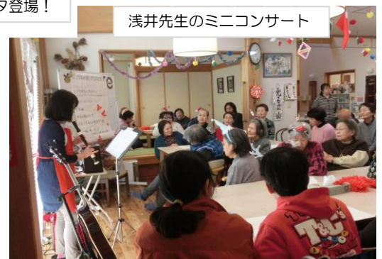
浅井先生のミニコンサート