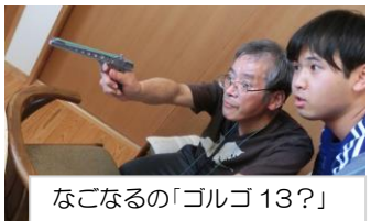
なごなるの「ゴルゴ13？」