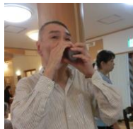
3時にジョージア 缶コーヒーを飲み ます