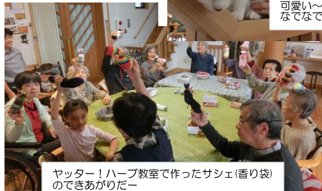
ヤッター!ハーブ教室で作ったサシェ(香り袋) のできあがりだー