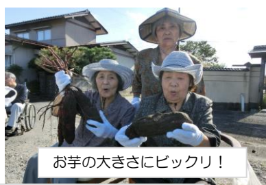
お芋の大きさにビックリ!