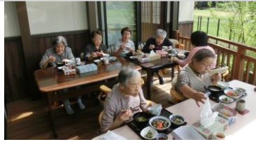
サマーボランティアの学生さん達 と楽しいランチ