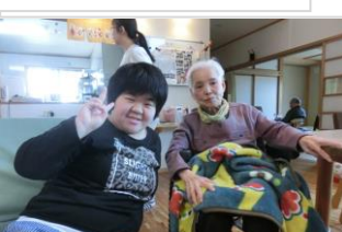
おばあちゃん、大好き!