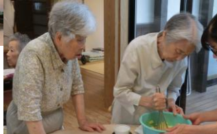
あんな、混ぜ混ぜ上手やね～