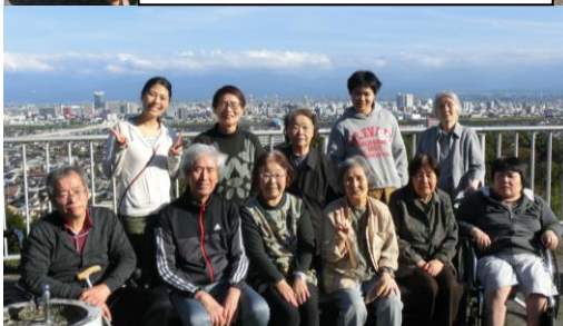
呉羽展望台からは、富山市内が綺麗に見えました