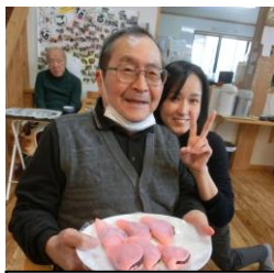
早く食べたいなあ～