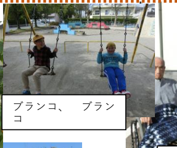
ブランコ、ブランコ