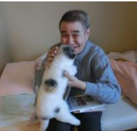
イヒヒ(笑) ネコかわいいね