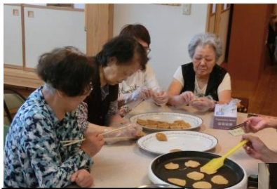
うまく焼けているわね