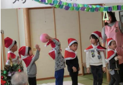
ボール運びのパフォーマンス。最後の人まであと少し、がんばって!

今年のクリスマス会は、不二越あじさい保育園の園児さん6名と先生と一緒に楽しみました。