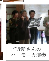
ご近所さんのハーモニカ演奏