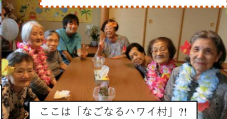
ここは「なごなるハワイ村」?!