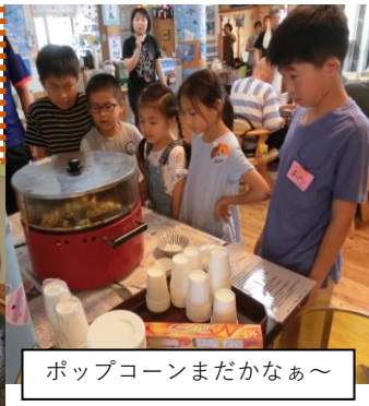
ポップコーンまだかなあ〜