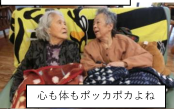
心も体もポッカポカよね