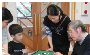
白熱の対決、オセロ&将棋