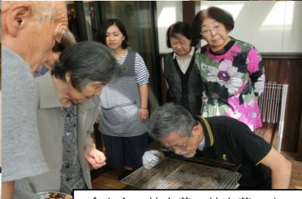
今から、焼き芋、焼き芋～♪