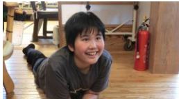
木の床は気持ちいいなあ