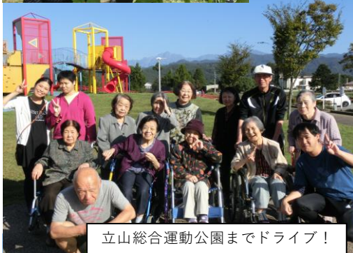
立山総合運動公園までドライブ!