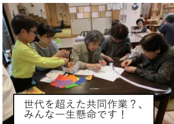
世代を超えた共同作業?、みんな一生懸命です!