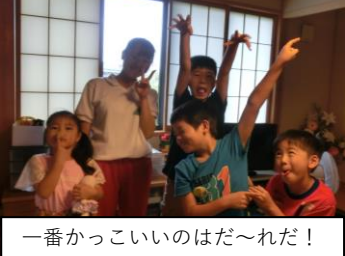
一番かっこのいいのはだ～れだ!