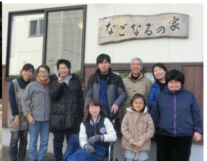
寒さに負けずお散歩!