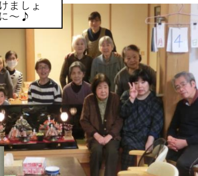
今年も元気で頑張ります!!