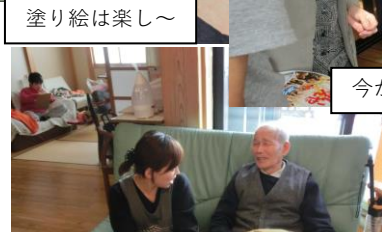
今日、お風呂入らなきゃダメ?