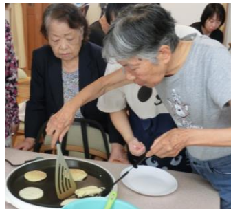
ひっくり返すわよ～、見ててね