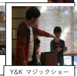
Y&Kマジックショーなんちゃって!