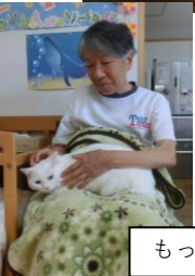
もっとなでなでしてあげるからニャ～