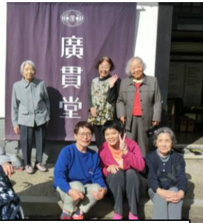
廣貫堂資料館って知ってる?