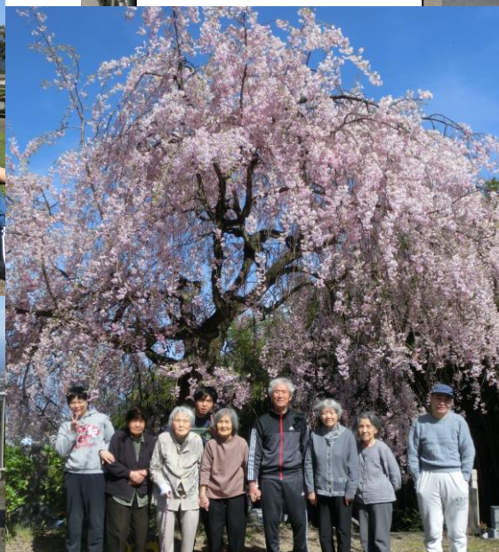
呉羽山でお花見! 満開のしだれ桜に感激です!