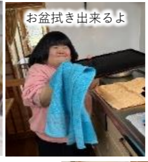
お盆拭き出来るよ