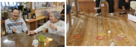
次はあそこ狙うわよ