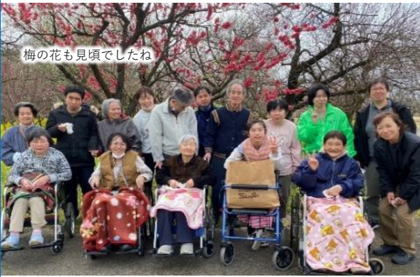
梅の花も見頃でしたわ