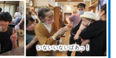
いないいないばあっ！