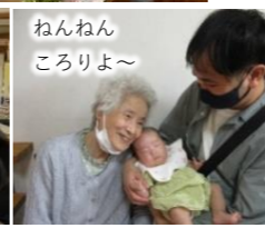
ねんねん ころりよ～