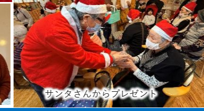
サンタさんからプレゼント