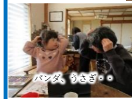
パンダ、うさぎ・・・