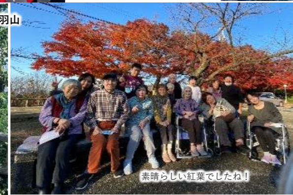
素晴らしい紅葉でしたわ！