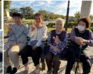
毎年恒例のお花見です