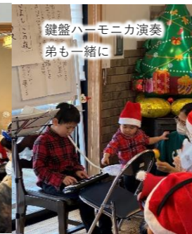
鍵盤ハーモニカ演奏 弟と一緒に