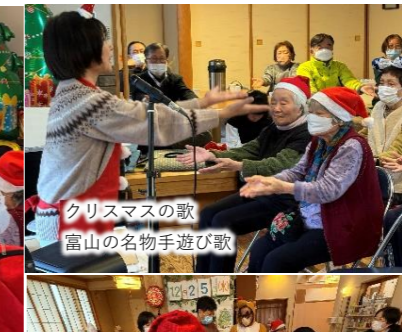
クリスマスの歌 富山の名物手遊び歌