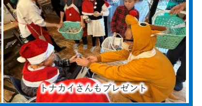
トナカイさんもプレゼント