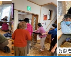
負傷者の応急処置