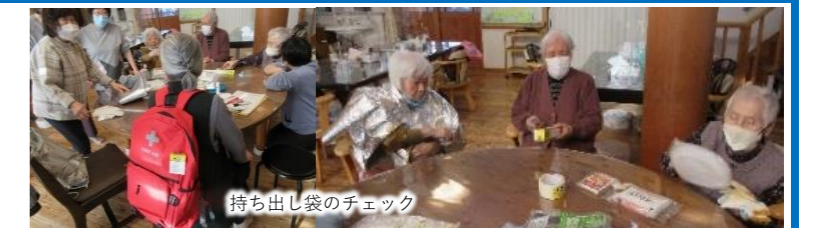
持ち出し袋のチェック

近年では、毎年のように全国各地で自然災害が頻発し、甚大な被害が発生しています。 いざという時が必要か、どう対応するのか、またその後どのように過ごすのか、などできるだけイメージして訓練を行っています。