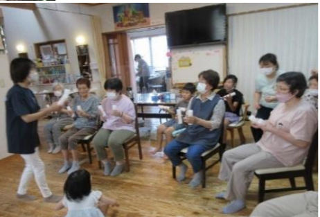
リズムに合わせて骨体操♪