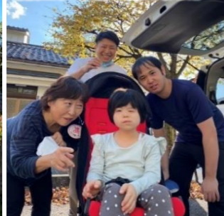
銀杏並木の紅葉をみてきました