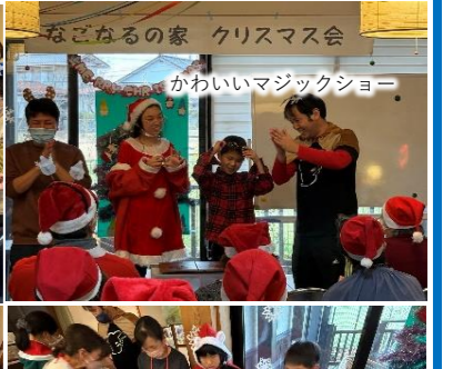
なごなるの家 クリスマス会 かわいいマジックショー